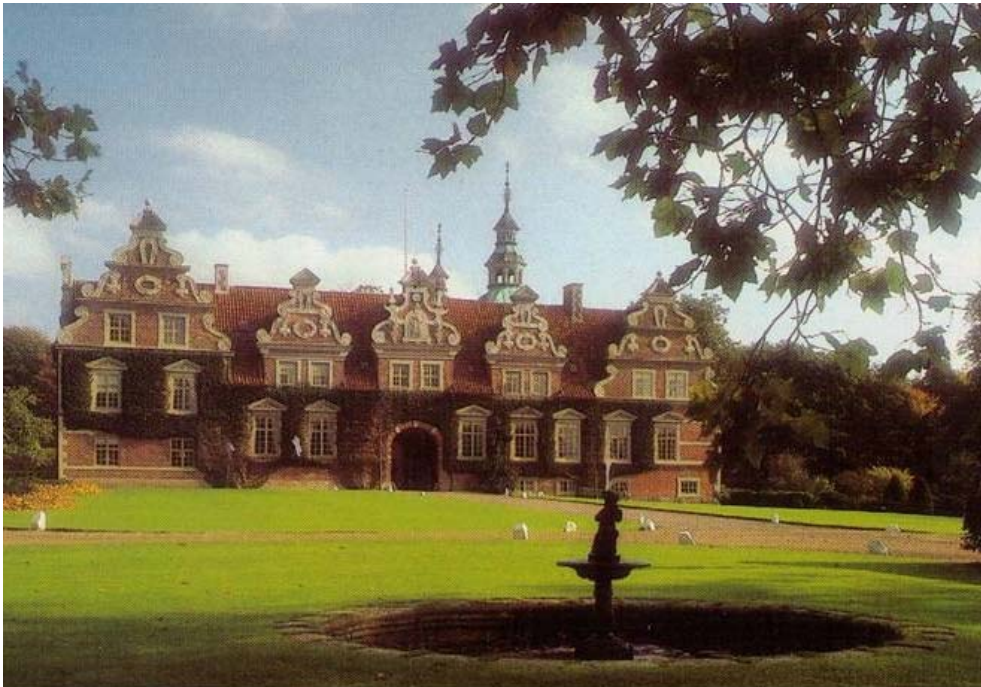
Figur 1 Slottet på Wrams Gunnarstorp i Bjuv

Fakta/unikt: Storskalig uppgradering av biogas och inmatning på gasnätet Biogödseln sprids med självgående slangspidare